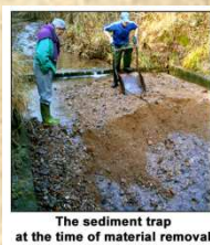
The sediment trap at the time of material removal