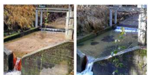
Sedimento nel 2002, vasca piena (28 m³, 06.12.2002), flusso di 0.1 m³/s (09.12.2003) vasca quasi vuota dal sedimento.

Periodicamente la trappola deve essere svuotata dai sedimenti